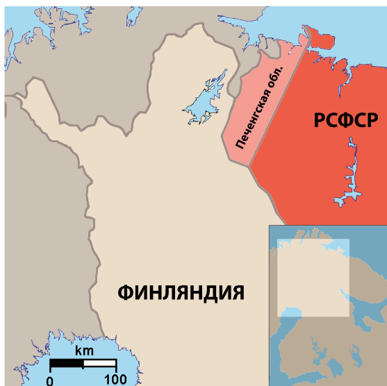
Печенгская область, перешедшая Финляндии в 1920 году

Завершилась 14 октября 1920 года подписанием Тартуского мирного договора между РСФСР и Финляндией, зафиксировавшего ряд территориальных уступок со стороны советской России.