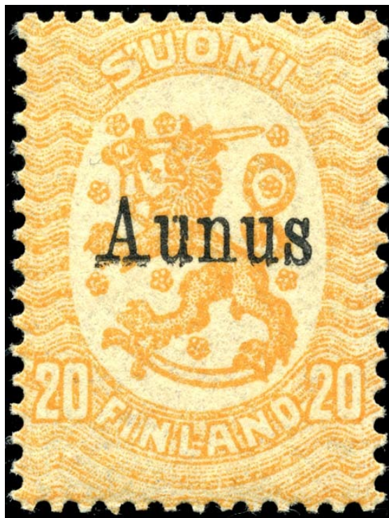
Финская почтовая марка для занятых территорий Карелии, с надпечаткой Aunus (Олонец, по-фински), 1919

Первая советско-финская война — боевые действия между белофинскими войсками и частями РККА на территории Советской России с марта 1918 по октябрь 1920 гг. Вначале велась неофициально. Уже с марта 1918 года, в ходе Гражданской войны в Финляндии, белофинские войска, преследуя противника (финских «красных»), пересекали российско-финляндскую границу и в ряде мест выходили в Восточную Карелию (см. Северокарельское государство). При этом, осуществляемые боевые действия не всегда носили характер партизанских (см. Олонецкий поход, Олонецкое правительство). Официально война с РФСР была объявлена демократическим правительством Финляндии 15 мая 1918 года [1] после разгрома Финляндской Социалистической Рабочей Республики. Первая советско-финская война явилась частью Гражданской войны в России и Иностранной военной интервенции на севере России.