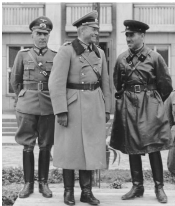
Гейнц Гудериан (в центре) и Семён Кривошеин (справа) наблюдают за прохождением подразделений XX моторизованной дивизии вермахта при передаче Брест-Литовска 22 сентября 1939 советской администрации [40] .

данных КМГ. 22 сентября в районе Сопоцкина отряд вступил в бой с частями 102-го и 101-го кп противника, а также с остатками уланского полка Домбровского и 13-го и 10-го пп, отходивших из Гродно. В бою были убиты 11 (из них 3 — расстрелянные поляками пленные) и ранены 14 красноармейцев, подбито 4 танка и 5 автомашин. Были взяты в плен 60 польских военнослужащих, остальные ушли в леса. Противник активных действий не предпринимал, а отходил, минировав дороги и оставляя отряды прикрытия. В ходе преследования отряд потерял 4 танка БТ-7, подорвавшиеся на минах. После боя у Сопоцкина отряд выступил на Сейны и к часу ночи 23.09 подошел к Августовскому каналу у г. Вулька, где был остановлен противником, оборонявшим левый берег. Мост через канал был сожжён. В 6 часов утра переправившаяся вброд рота танков, разгромила противника, заставив его отступить. 23 сентября 20-я мсбр была выведена к Даброву, где ликвидировала остатки польских частей, пытавшихся уйти в Августовские леса. Мототряд 16-го стрелкового корпуса в 20.20 23 сентября занял без боя Августов.