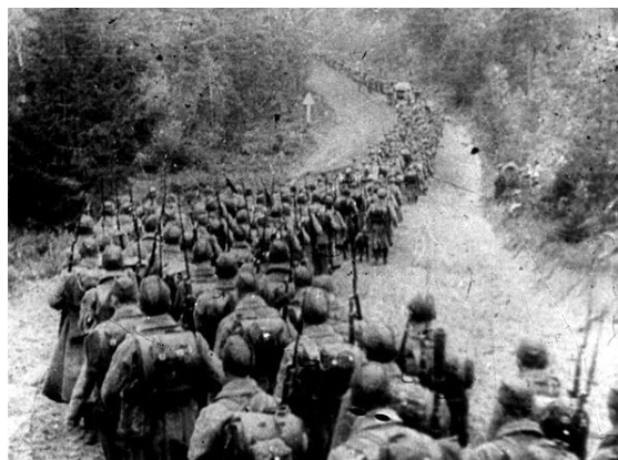
Советские войска пересекают границу Польши. 1939.

Войска перешли границу в 5:00, сломив незначительное сопротивление польских пограничных частей. Севернее части 60-й стрелковой дивизии в 6:00 перешли границу, в ходе боя с польской погранстражей советские войска потеряли 1 человека убитым и 1 раненым. Противник потерял 3 пограничников убитыми, 2 ранеными, а 83 были взяты в плен. В течение