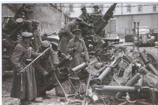
Осмотр бойцами РККА трофейного оружия: пулемётов и зенитных орудий в Бресте

Как отмечал немецкий генерал Г. Гудериан, жёсткое требование советской стороны об отводе немецких войск не позволило им вывезти трофейное вооружение и военное имущество польской армии, захваченное восточнее демаркационной линии в ходе боевых