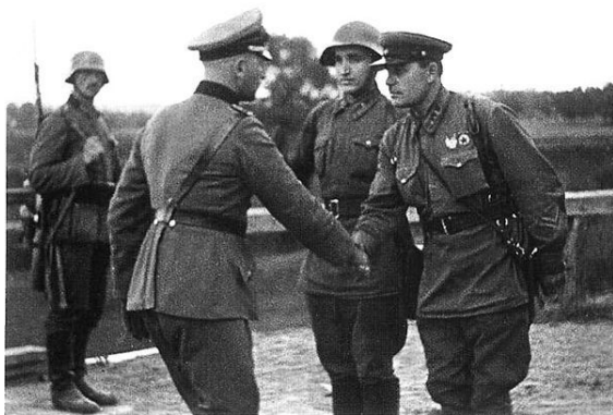
Сентябрь 1939 года, конец польской кампании. Немецкий и советский офицеры пожимают друг другу руки