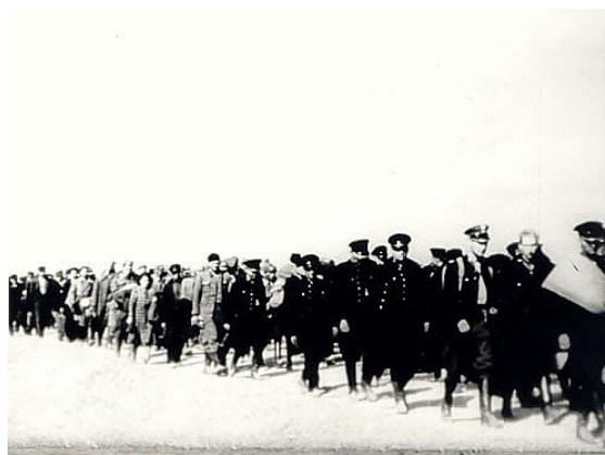
Пленные польские жандармы.

тически не имея стычек с противником. 36-я легкотанковая бригада в 7 часов 18 сентября заняла Дубно, где были разоружены тыловые части 18-й и 26-й польских пехотных дивизий. Всего в плен попало 6 тыс. военнослужащих, трофеями бригады стали 12 орудий, 70 пулемётов, 3 тыс. винтовок, 50 автомашин и 6 эшелонов с вооружением. В 11.00 18 сентября подразделения группы после небольшого боя вступили в Рогачув, где были взяты в плен 200 польских военнослужащих и захвачено 4 эшелона со снаряжением и боеприпасами. К 17.00 18 сентября 36-я танковая бригада и разведбатальон 45-й стрелковой дивизии вступили в Луцк, в районе которого было разоружено и взято в плен до 9 тыс. польских военнослужащих, а трофеями советских войск стали 7 тыс. винтовок, 40 пулемётов, 1 танк и 4 эшелона военного имущества.