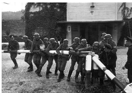
1 сентября 1939 г. Немцы уничтожают польско-данцигскую границу в районе Сопота

1 сентября 1939 года войска Германии и Словакии нападением на Польшу начали боевые действия в Европе, ставшие началом Второй мировой войны. Несмотря на ожидание нападения, польская армия оказалась не способна противостоять агрессии Германии. Англия и Франция, заключившие с Польшей союзнические договоры и также готовившиеся к боевым действиям, вместо оказания обещанной военной помощи Польше продолжили поиски путей умиротворения Германии, ведя через Муссолини переговоры о созыве конференции в Италии для обсужде-