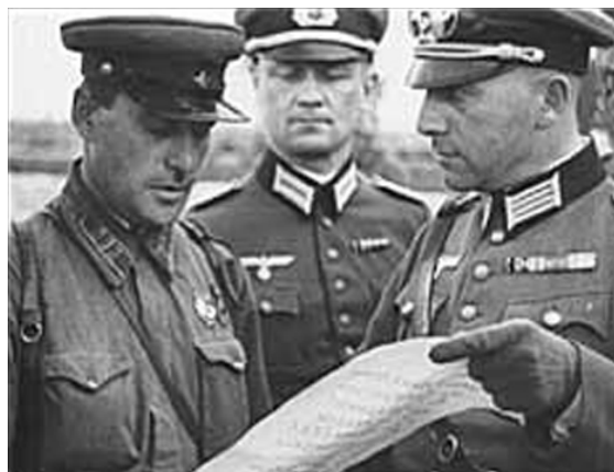
Советские и немецкие офицеры в районе Бреста. Из немецкой кинохроники. Немецкий офицер показывает советскому листовку на русском (с элементами дореволюционной орфографии), которую тот вслух читает:

10-я армия. Продолжая выдвижение во втором эшелоне Белорусского фронта, войска армии к исходу 20 сентября вышли на рубеж Налибоки, Деревна, Мир, где получили задачу выдвигаться на фронт Сокулка. Большая Берестовица, Свислочь, Новый Двор, Пружаны. Вечером 10-й армии были подчинены войска 5-го стрелкового, 6-го кавалерийского и 15-го танкового корпусов. Однако уже 21 сентября было решено оставить 6-й кавалерийский и 15-й танковый корпуса