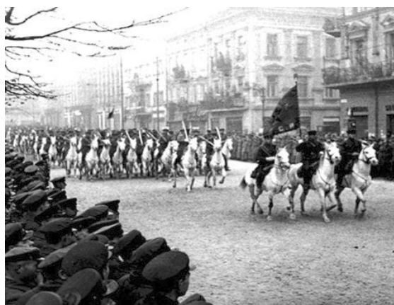
Кавалерия РККА во Львове. 1939.