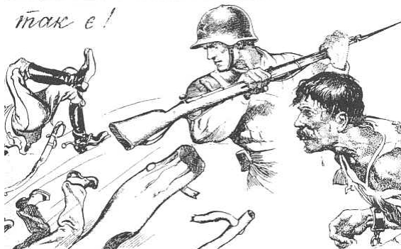
«Так было. Так есть.» Украиноязычный советский плакат

общий упор в публикациях делался на «освобождении угнетенных украинцев и белорусов». [55]