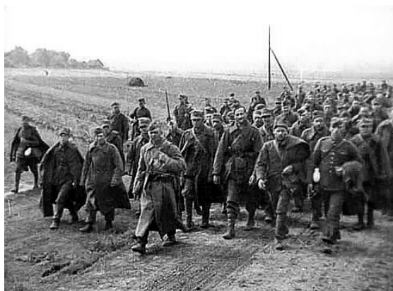
Польские солдаты, пленённые частями РККА. 1939.

В 23 часа группа вступила в Лиду, уже занятую 152-м кавполком 6-го кавкорпуса КМГ.