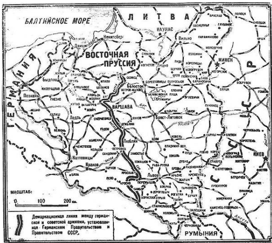
Демаркационная линия между германской и советской армиями, установленная 20 сентября 1939 года

После вступления частей РККА на польскую территорию, в немецком генеральном штабе в первой половине дня 17 сентября происходит обмен мнениями относительно будущей демаркационной линии. Войскам отдается приказ «остановиться на линии Сколе — Львов — Владимир-Волынский — Брест — Белосток». Для войск, уже находящихся за этой линией, задачи были оставлены практически прежними — в Группе Армии Север XXI корпус в районе Белосто-