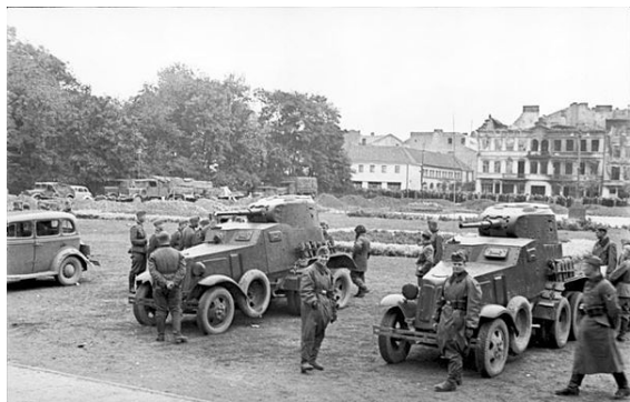
Бронеавтомобили БА—10 советской делегации в Люблине.

и 1,5 тыс. лошадей. 26-27 сентября 36-я лтбр оставалась в Холме, ожидая подхода стрелковых частей 15-го корпуса, которые 25-26 сентября форсировали Западный Буг. 28 сентября 36-я лтбр выступила в направлении Люблина, но, достигнув в 12 часов Пяски, выяснилось, что город занят германскими войсками. В 10 часов 29 сентября советские делегаты прибыли в Люблин для переговоров об отводе германских войск, которые по ранее принятым условиям должны были к вечеру оставить город. Однако германское командование не собиралось отводить войска, ожидая приказов из Берлина.