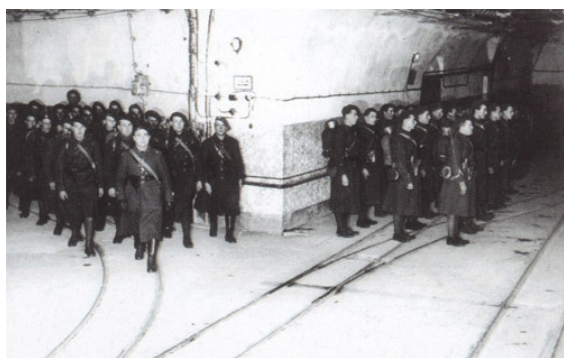
Французские солдаты на линии Мажино, 1939 г.

ния «затруднений, вытекающих из Версальского договора». Лишь 3 сентября в 11:00 Англия, а в 17:00 Франция объявили Германии войну. 4 сентября был подписан франко-польский договор о взаимопомощи, фактически так и не получивший реализации. Уже к 4 сентября мобилизация во Франции завершилась, а войска были развернуты на позициях. На появившемся «втором фронте» против Германии французские войска, передовым частям которых было запрещено заряжать оружие боевыми снарядами и патронами, безучастно взирали на германскую территорию в то время как немцы продолжали возведение укреплений. Французские военно-воздушные силы ограничивались разведкой, а проведённый 4 сентября английскими ВВС (10 бомбардировщиков) налёт на рейд в Киле, в котором была потеряна половина самолётов, не имел результатов [3] , а в дальнейшем англичане (по признанию Черчилля) «ограничивались тем, что разбрасывали листовки, взывающие к нравственности немцев». Неоднократные просьбы поляков о военной помощи оставались без ответа, а в отдельных случаях их просто дезинформировали.