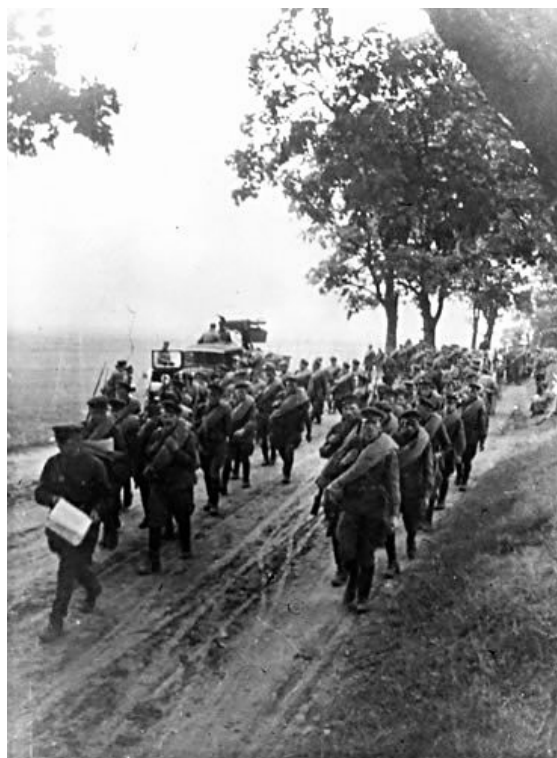
Стрелковые части РККА в Польше. 1939.

В 5 часов утра 17 сентября войска 4-го стрелкового корпуса и подвижной группы в составе 24-й кавалерийской дивизии и 22-й танковой бригады под общим командованием комбрига П. Ахлюстина перешли границу и при содействии пограничников уничтожили польскую пограничную стражу: были убиты 21 и пленены 102 польских пограничника. Наступавшие от Ветрино 5-я стрелковая дивизия и 25-я танковая бригада к вечеру через Плиссу подошли к северной окраине Глубокого. Наступавшие на направлении главного удара части подвижной группы в 8 часов заняли Докшицы, к 18 часам — Дуниловичи; дальнейшее продвижение танковые части остановились по причине отсутствия горючего. Пехотные соединения значительно отстали: 27-я стрелковая дивизия заняла в 12 часов Парафианово и подходила к