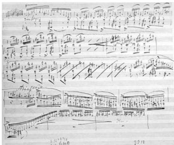
Часть оригинального манускрипта фортепианной сонаты в си миноре S.178 Ференца Листа (1852-53).

Сона́та (итал. sonare — звучать) — жанр инструментальной музыки, а также музыкальная форма, называемая сонатной формой. Сочиняется для камерного состава инструментов и фортепиано. Как правило, соло или дуэта. Ряд инструментальных пьес, написанных для многих оркестровых составов, принято называть не сонатой, а большим концертом (итал. concerto grosso ). Также словом «соната» может называться собрание пьес в одно целое, потому что некоторые из этих пьес написаны в сонатной форме.